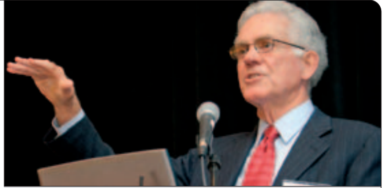
شرکت اوراکل Oracle از شناخته شده ترین شرکت هایی است که در زمینه تولید نرم افزار فعالیت می کند. در سال ۱۹۷۷ میلادی این شرکت با نام RSI، کار خود را آغاز کرد

پدر من هم به شکل و روش خاص خودش مرا تشویق می کرد. مانند پدری که در فیلم «روز بی نیازی» بود، پدر من هم اعتقاد دارد که یک مرد موفق هر چیزی را می داند و در همه امور تخصص دارد. این اعتقاد از نظر بسیاری از افراد غیرمنطقی به نظر می آید اما شاید برای من یکی از دلایل رسیدن به موفقیت بود.